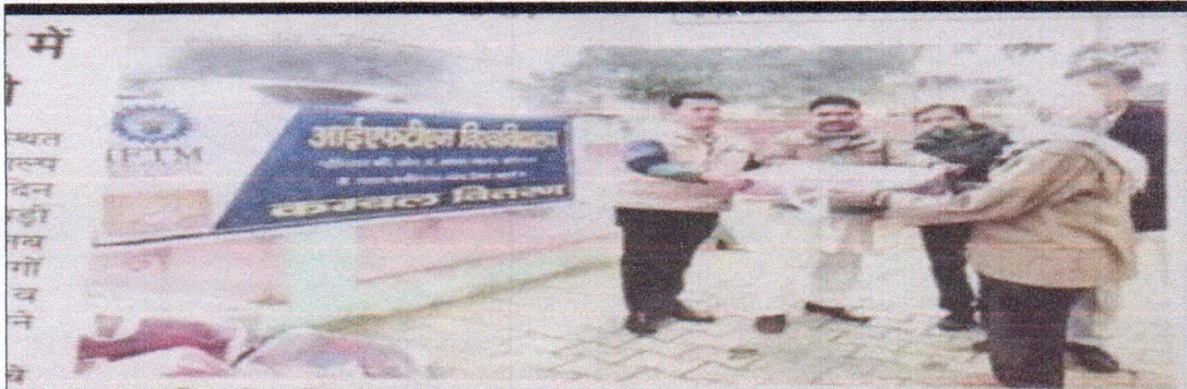
आइएफटीएम विश्वविद्यालय में जरूरतमंदों को कंबल वितरित किए गए - सी. विश्वविद्यालय